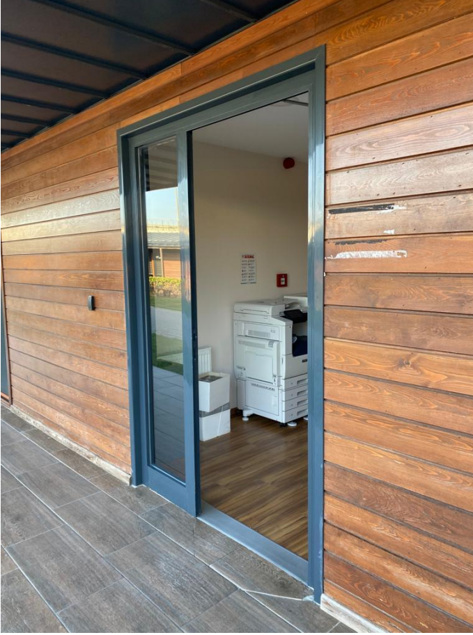
DIŞ ALÜMİNYUM KAPI