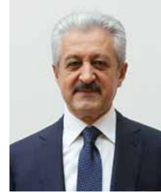
MEHMET ALİ AYDINLAR Türkiye Futbol Federasyonu Başkanı